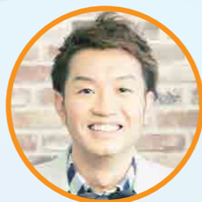
実況: 大抜卓人 (FM802)