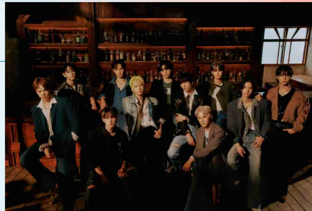
ファッションランウェイゲストモデル JO1